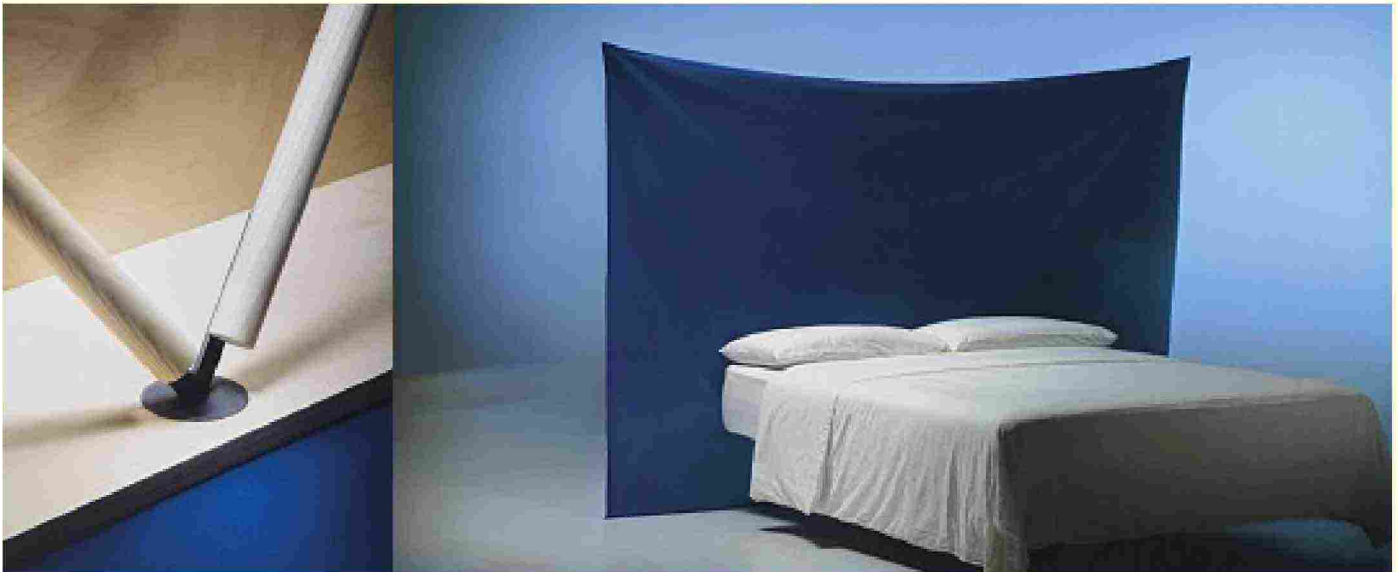
Sopra, Backdrop di Julie Richoz con il dettaglio dell'aggancio del telo alla base della testiera. A centro pagina, Courtoisie di Sam Baron; zoom sul comodino, che riprende il bordo curvo della testata. In alto, Fiocco di Martino Gamper: le ali pieghevoli di olmo e noce integrano una mensola. Nella pagina accanto, Rosary di India Mahdavi impreziosita da anelli di ceramica personalizzabili. — Above, Backdrop by Julie Richoz, with a detail showing how the blue fabric is secured to the base of the headboard. Centre, Courtoisie by Sam Baron, with a close-up of the bedside surface that repeats the curved design of the headboard. Top, Fiocco by Martino Gamper, featuring foldable elm and walnut wings and an integrated shelf. Facing page, Rosary by India Mahdavi, embellished by customisable ceramic rings.