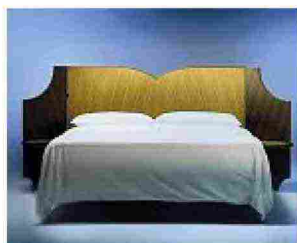
Fiocco di Martino Gamper per Bolzan