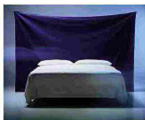
Backdrop , su disegno di Julie Richoz