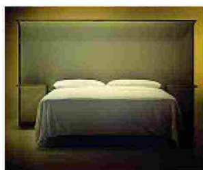
Courtoisie , su disegno di Sam Baron